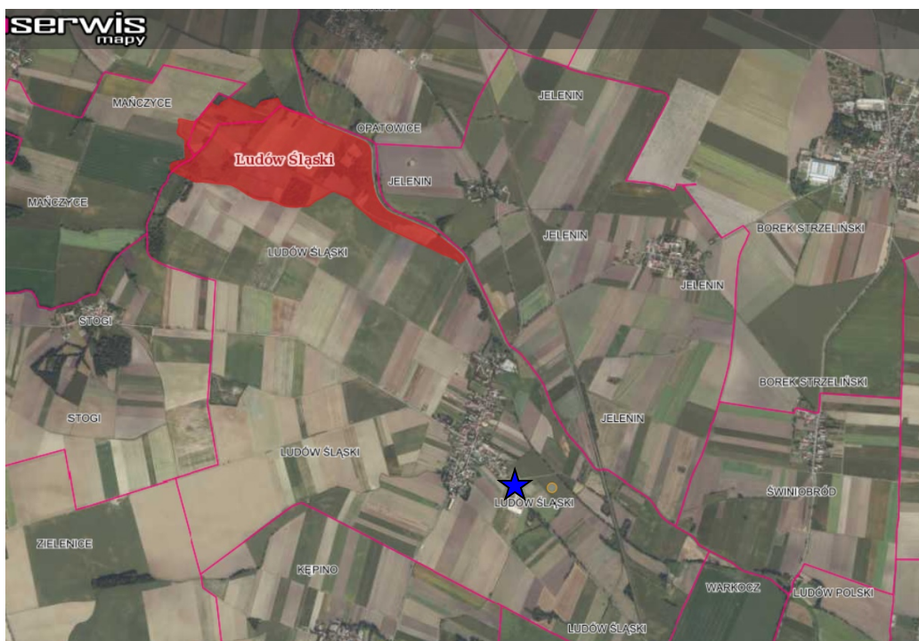
Ryc. 3 Położenie obszaru objętego planem na tle obszarów NATURA 2000