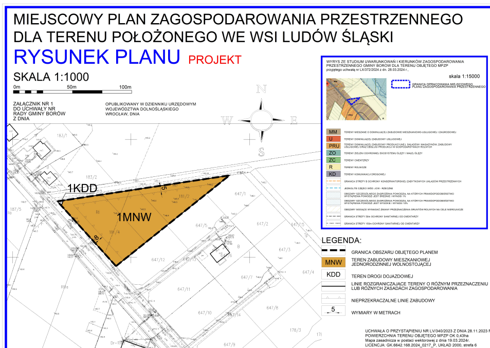
Ryc. 1 Rysunek projektu miejscowego planu zagospodarowania przestrzennego dla terenu położonego we wsi Ludów Śląski