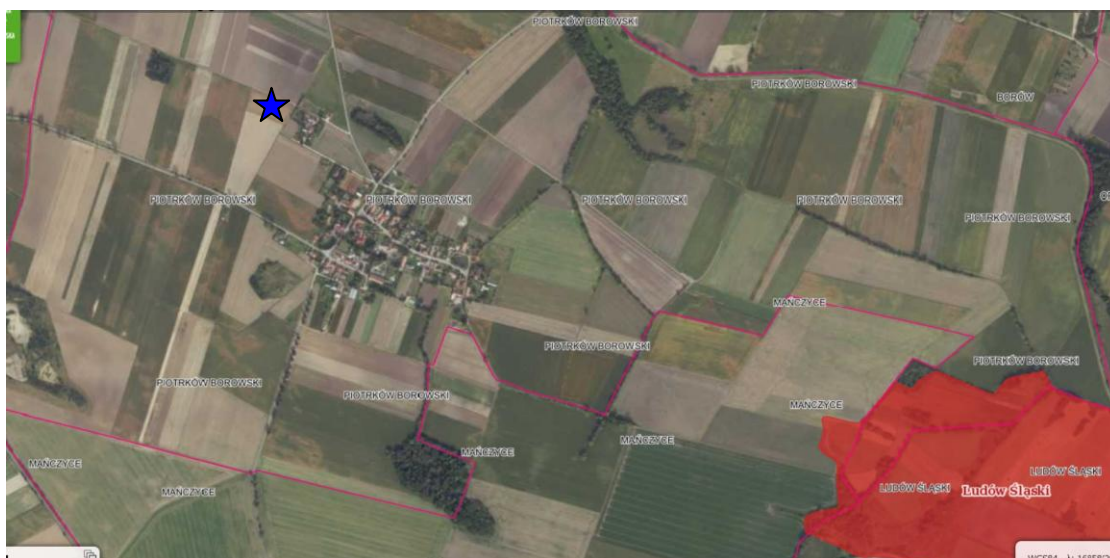
Ryc. 3 Położenie obszaru objętego planem na tle obszarów NATURA 2000